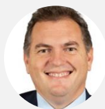
Philippe Tabarot Rapporteur Sénateur des Alpes-Maritimes (Les Républicains)

COMMISSION DE L'AMÉNAGEMENT DU TERRITOIRE ET DU DÉVELOPPEMENT DURABLE